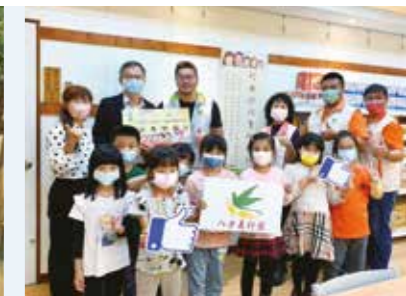
• 2022年校園迷你實物銀行崇德國小站捐贈儀式。