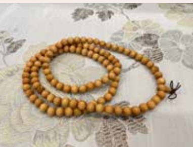
• 淡淡的花香氣息，是龍柏木手珠最特別的地方。

菩提樹者，即畢鉢羅之樹也。昔佛在世，高數百尺，屢經殘伐，猶高四五丈，佛坐其下成等正覺，因而謂之菩提樹焉。」菩提樹即畢鉢羅樹，因佛陀於樹下悟道而成名，但畢鉢羅樹的種子細小，果實質地不堅硬，並不適合做念珠。因此，一般所謂的菩提子念珠並非菩提樹所結的果實，而是一種名為川殼的植物所結的果實，果實有硬殼，一般用來製作佛珠，所以人們稱之為菩提子，用它做的念珠就叫做菩提子念珠，較為常見的有星月菩提、鳳眼菩提、龍眼菩提等等。