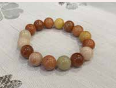
• 黃玉被認為是財富的象徵，具有招財功效，能夠促進事業興旺、財源廣進（老黃玉念珠）。