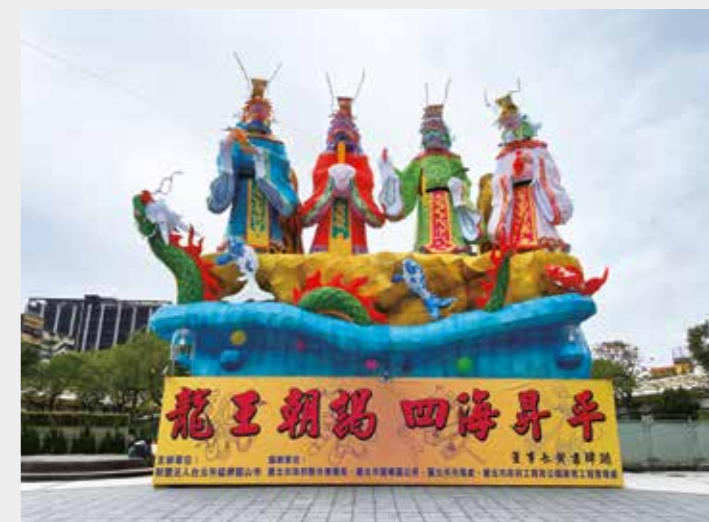
• 2024年龍山寺於艋舺公園設置「龍王朝謁 四海昇平」主題燈籠。

龍山寺陪伴人們度過285次的新年，祖輩們參與了過去，我們參與了當下，子孫們會參與著未來，在不同時期感受這淵遠流長的新年風俗，特別是在這富有文化傳統與吉祥寓意的龍年。我們相信甲辰龍年一定會為人間帶來溫馨祥和的氣氛，人人處世圓融無礙，人間充滿希望。也祝福大家甲辰龍年龍耀祥瑞，百福駢臻，讓我們共同祈願新的一年國際安定，四時無災，八節有慶，臺海安和，國富民強。