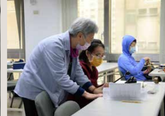
• 同儕間的相互幫助與扶持可裨益彼此的學習。

師也會隨機分享自己學佛心得，為學員在學佛道路及落實佛法上增廣見聞。最後，在下課前由各組輪流帶領大家將薰習梵唄功德圓滿迴向，祝福自己並祝福大家在生活中更美好，佛道上更精進。