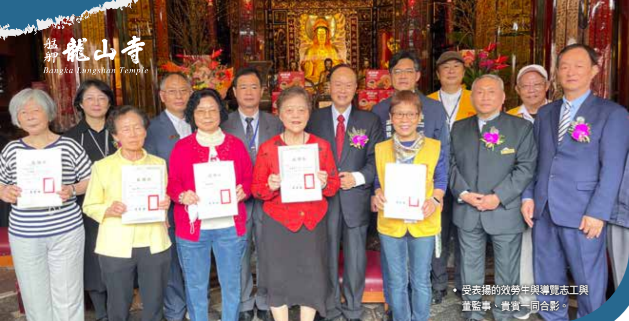
受表揚的效勞生與導覽志工與董監事、貴賓一同合影。