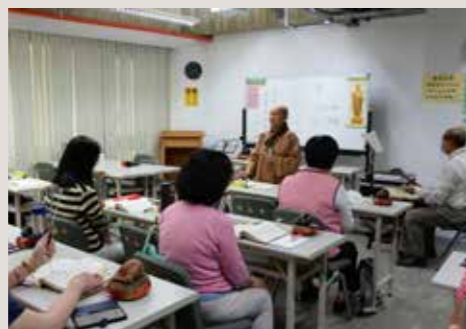
• 學員們跟隨法師以清淨心詠唱出梵唄的熱情、感動與寧靜。