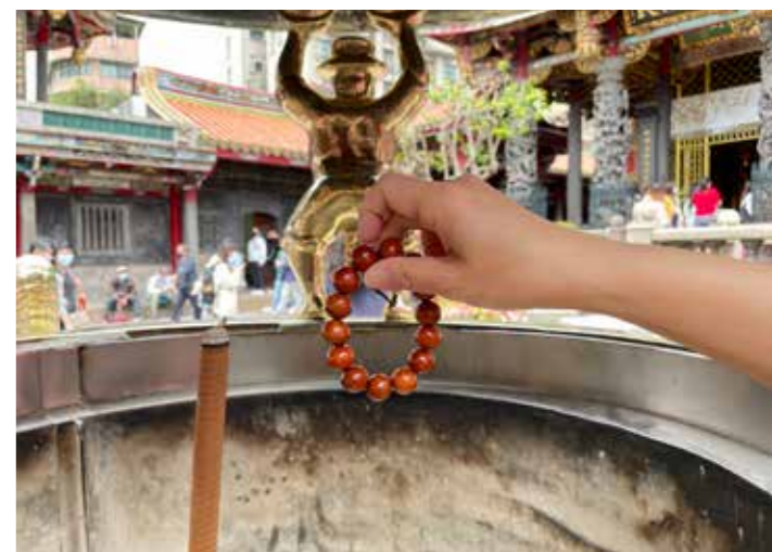
• 如同香火袋護身符一樣，可以將念珠在香爐上過香火，以獲得神力保護自己。

在選購念珠時，若要念誦用，可用習慣念誦次數的倍數去選。若不是用來念經，可以根據自己的喜好來選擇樣式、材質，挑自己喜歡或看得順眼的就可以。若配戴念珠沒有特殊的宗教信仰，純粹只是祈求平安，則可以到一般寺廟，在香爐上