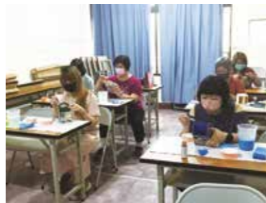
• 協會開設成人技職教學班，增加第二專長學習機會。