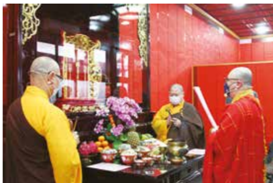
• 農曆正月十五日循例於太歲廳內，安奉值年太歲星君。

民俗上認為沖犯太歲者在當年度容易諸事不順，在事業或財運上可能會遇到不利，身體多病變，以及認為太歲年容易讓人心神不寧，虛浮不安，影響情緒而招致災禍，應於當年祭拜太歲神，用以安穩心神，祈求趨吉避凶，迎祥納福，整年順利利，此活動便為「安太歲」、「拜太歲」。早期臺灣人安太歲是在家中擺設太歲神位一年，晨昏供奉祭祀。1990年代起，因為工商業發達，人們生活忙碌，大多會到廟裡安太歲，以求趨吉避凶，平