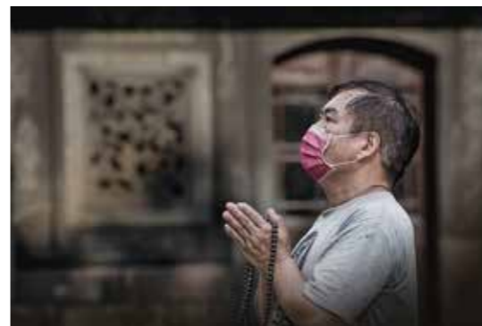
• 一句佛號、一顆念珠，計數持念，讓念佛時更心無罣礙，一心稱誦。

不同款式的念珠，其構成也有細微的差別，以 108顆 串成的念珠來說，基本元素有母珠、子珠、數取、記子、記子留等等。母珠有一顆及兩顆兩種，用以將不同數目的子珠歸於一處，此珠一般具有三孔，同時可以連接子珠、記子或玉珮、流蘇等飾品。子珠指用以計數的珠子。數取又稱間珠、隔珠，用來將珠子平均分隔，方便計數，材料及大小與子珠不同。記子又稱弟子珠，一般有十顆、二十顆，或四十顆，串在母珠的另一端，多以十顆為一小串，表示十波羅蜜，為記遍數用，捻珠念佛滿 108 次後，即撥動一記子。現今因為有了電子計數器，讓念佛計數更方便，推測因此弟子珠位置大多變成了裝飾