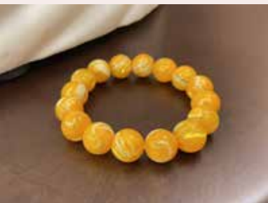
• 碑磬是佛教七寶之一（黃金碑磬念珠）。