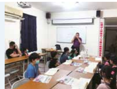
• 協會開設口風琴課程，學子可以學習才藝技能。