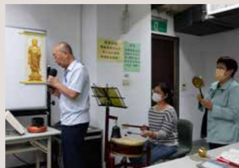
• 下課前的功德迴向是各組學員展現團隊合作及演練成果的機會。