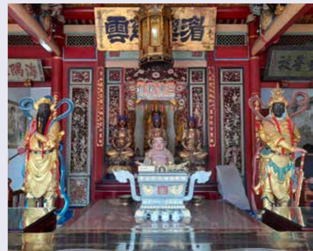
• 韋馱天將與伽藍尊者一同侍立於佛陀左右，擔綱護法衛教的責任，祀典大天后宮的韋馱、伽藍為黑臉，別有特色。（攝於臺南市中西區祀典大天后宮三寶殿）