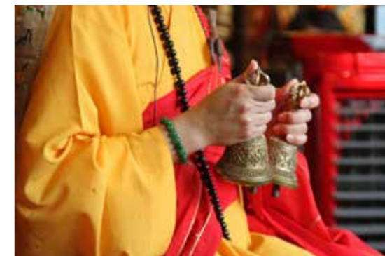
• 念珠是吉祥、是圓滿、是佛心的表徵。