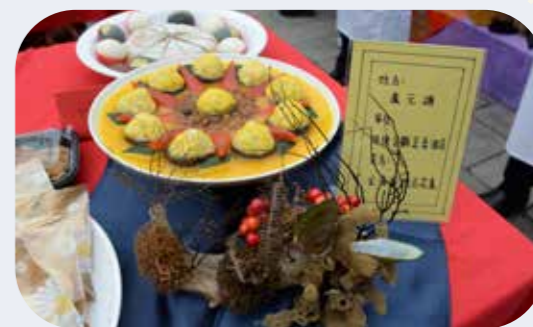
蔬食飲食不僅有益健康，也是一種護生行善的行為。

板橋文化廣場提早於國曆3月16日舉行「恭祝觀世音菩薩聖誕普門品大悲懺共修法會」，禮請圓覺禪林住持見拓法師帶領與會信眾，以顯密融合方式，共修《普門品》、《大悲懺》、《四臂觀音修法》。法師在會中也開示，修學觀音法門的行者，必須具備慈悲心、大願心、菩提心，以菩提道依歸，切勿陷入自私自利、慳貪瞋恨，因為這是很難與菩薩感知相