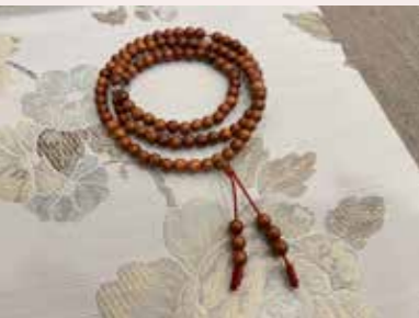
• 花梨木的香氣可以穩定情緒，放鬆身心，使人變得平靜、沉穩。