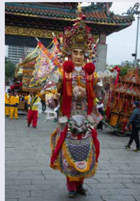
• 坐相韋馱造型特別，尚有神將（大仙尪仔）形式的韋馱天將於佛祖出巡時為前導護駕，如艋舺龍山寺觀音佛祖與前韋馱護法。

而從這些佛寺乃至民間對於韋馱天形象的再詮釋，也反映出，受「修童貞行」的影響，故後人多將韋馱塑造成唇紅齒白的年青將軍模樣，但誰說祂不能是位美髯公呢？又其「護法衛教」的特性，加上「離欲修行」又與僧團的相性非常契合，這也解釋了為何佛教的護法神一籬筐，但韋馱天將卻是最受矚目之護法神沒有之一的原因呀！