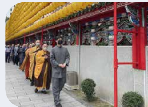
法師帶領大眾於寺內外繞佛，為平安燈灑淨。