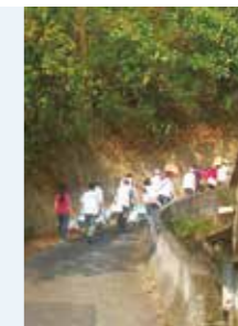
• 志工徒步搬運物資分送給偏鄉山區的獨居長輩。