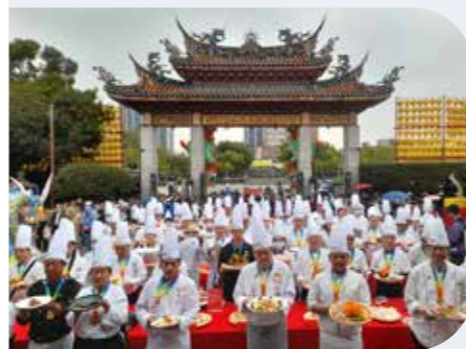
108位大廚端著珍奇素菜，向觀世音菩薩供養祝壽。

觀音偈：「瓶中甘露常遍灑，手內楊枝不計秋。」觀世音菩薩時常手持楊柳枝，沾著淨瓶內的甘露，遍灑於各處的每一眾生，為大家帶來平安與清淨。在今年的觀音誕辰之日，大家以聞法修持、茹素行善、奉獻服務等方式讚嘆、感謝、恭賀觀世音菩薩，更誠心祈願菩薩甘露遍灑三千，護佑芸芸眾生離諸苦難，同享安樂。