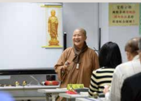
• 自性法師教學以輕鬆快樂模式進行，並且也時常鼓勵學員。

我參加課程快兩年了，因為參加法會對梵唄產生興趣，又因為學佛受戒轉認識自性法師並向他學習梵唄。師父每一期課程訂定一個主旨（如《藥師懺》）的方式，讓我們不僅學會梵唄還可攝受經典涵義，且師父教學嚴謹有訣竅，不失鼓勵與引導且有耐心，對於平時還要上班的我，不會因為練習時間不多而退卻，反而想要繼續報名並一直更精進。我覺得每一次上課是來充電、沉澱，師父的開示還可以化解工作中無形的負能量。