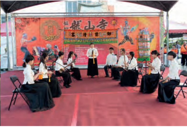
汾雅齋南管樂團的音樂婉轉悠揚。