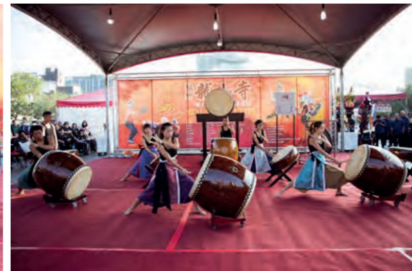
鼓聲響徹雲霄，替寺慶掀起熱潮。