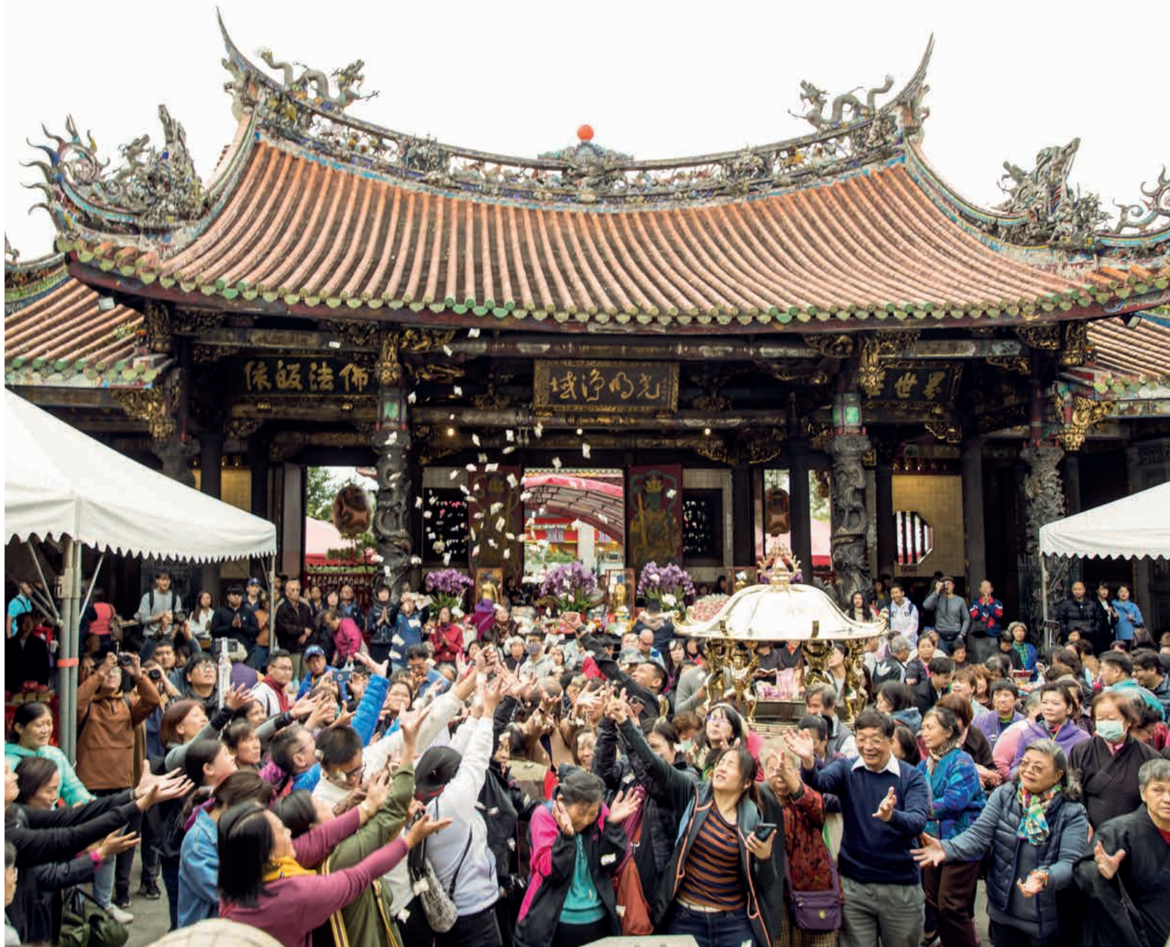
寺慶最後一天舉行圓滿齋天，將糖果鮮花分發給信眾。

身為國家古蹟，艋舺龍山寺致力於保持與維護寺裡的建築藝術，持續舉辦各類宗教慶典活動，傳承各項傳統文化與觀念，並肩負起更多社會責任，落實觀音菩薩慈悲大愛之精神。我們期許下一個十年，有更豐碩的成果，在固有的文化基礎上，展現出傳統與現代交融的百年宮廟風華。