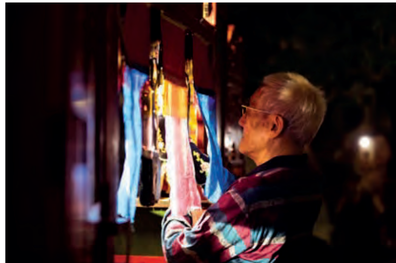
布袋戲國寶藝師陳錫煌師傅現場親自演出。