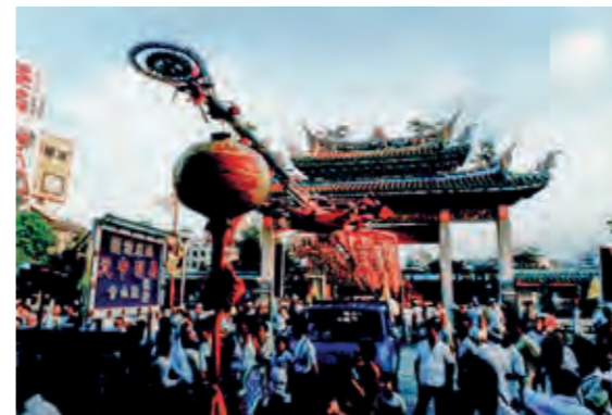
民國 68 年舉行艋舺龍山寺 240 週年慶