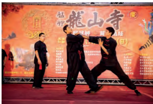
淡水青島武館展現精湛武藝。