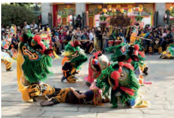
小朋友們的表演，生動有趣，大人小孩都愛看。