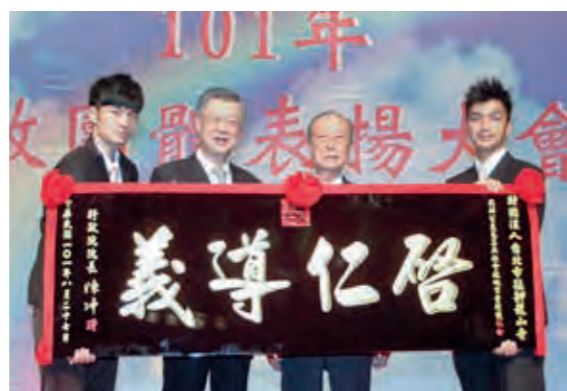
民國 101 年宗教團體表揚大會

10月2日 本寺對外公告婉謝香客提供香枝，以改善劣質香枝燃燒造成環境污染的情況。