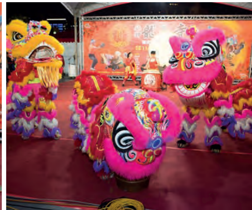
臺北慶和館醒獅團融合醒獅與鼓陣的演出。