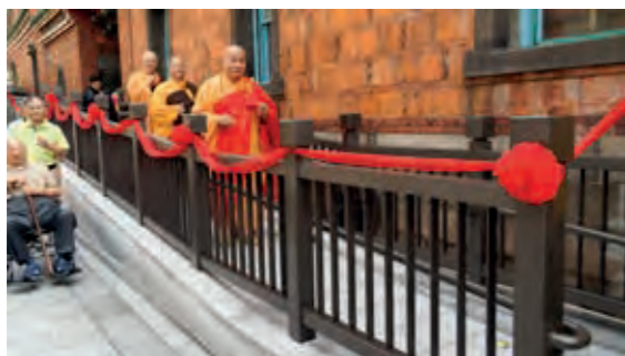
民國 103 年舉行本寺西側無障礙坡道改建落成典禮