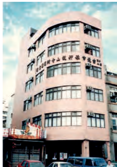
民國 71 年圖書館完工