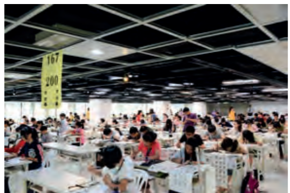
民國 102 年舉行第一屆艋舺龍山寺盃全國學生書法比賽

7月27日 召開第五十次會員大會，個人會員 34 名，團體會員 10 名，合計 44 名。