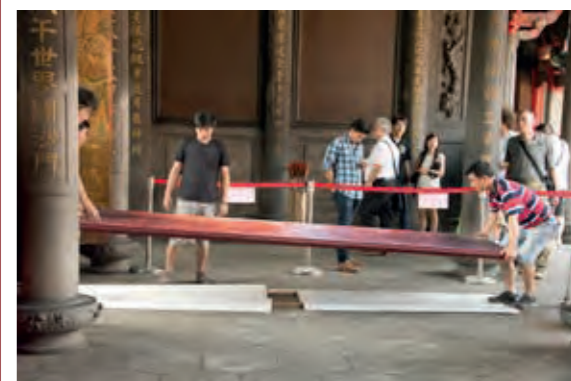
民國 107 年進行門神修復

8月7日 召開第十九屆董監事第一次董事會，選出黃書瑋、高而潘、吳祚明、黃世守、連錦綉等五名為常務董事，黃欽山為榮譽董事長。