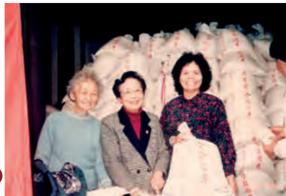
民國 75 年冬令救濟