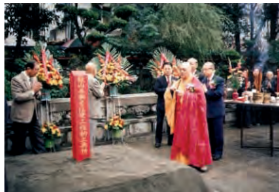
民國 81 年東側禪房破土典禮