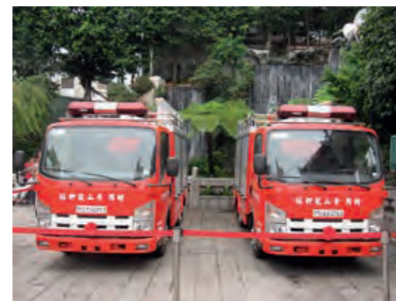
民國 100 年捐贈臺北市政府消防車