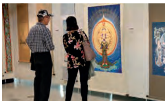
觀音佛畫展吸引許多人前來參觀。