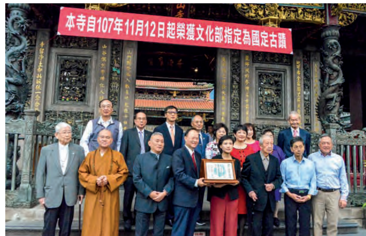
本寺董監事及文化部部長一同在三川殿前合影留念。