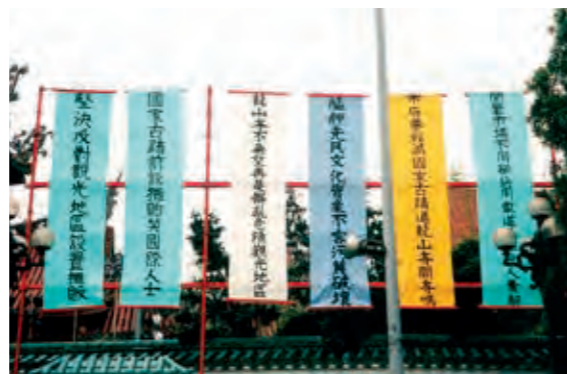
民國 88 年抗議市府寺前車道設置攤販