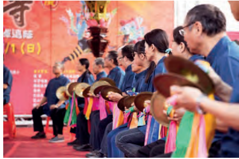
縣定古蹟北港集雅軒的北管唱奏。