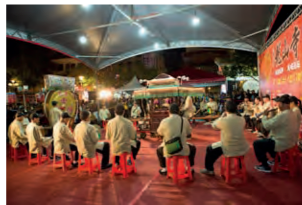
雲林金聲順古樂協會是全臺最古老的開路鼓樂陣。

武術是中華民族文化的重要組成部分，不僅是一種強身健體、自衛助人的運動，而且更與中國的傳統藝術互相融合，成為富有娛樂性的表演活動。淡水青島武館以精湛的武藝，讓現場民眾大開眼界，長拳、螳螂拳、地躺拳，刀、劍、棍棒等各種兵器的對打，在刀光劍影中彷彿走入武俠電影場景。