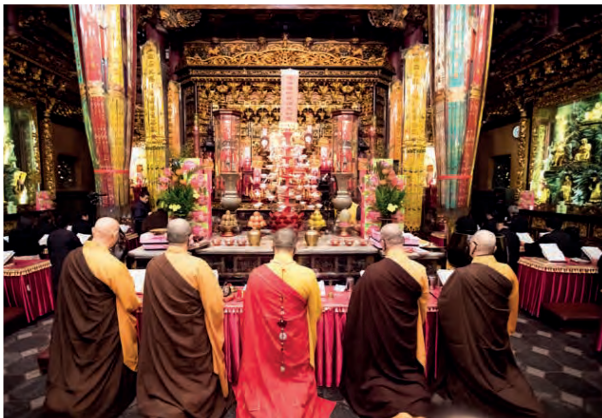
慶祝寺慶舉辦護國息災祈安植福法會。