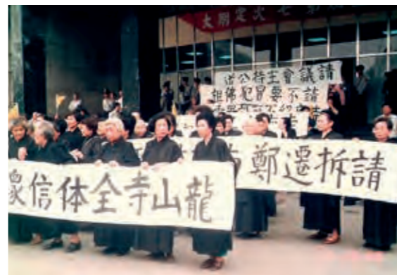
民國 78 年至議會請願，請求協助撤除鄭南榕靈堂