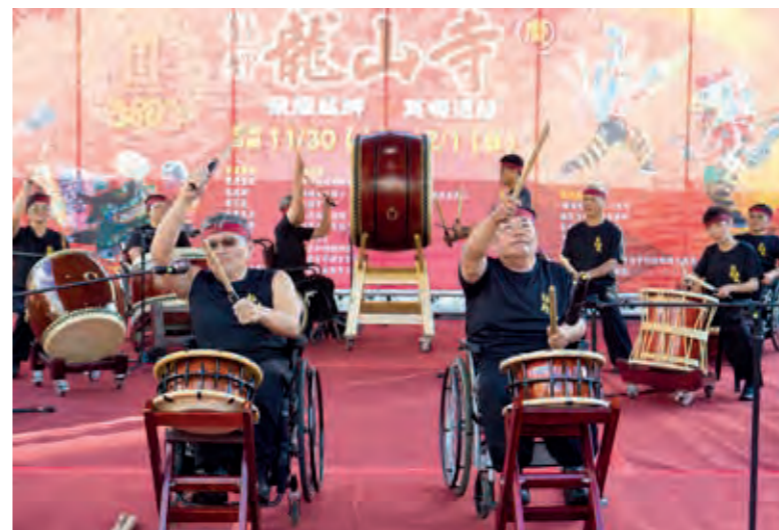
輪轉太鼓團用鼓聲傳達生命熱情。

來自雲林縣的飛沙國小、嘉義縣灣潭國小、嘉義縣柳溝國小的小朋友們，讓廟埕廣場頓時熱鬧了起來，有龍、鳳、獅頭及鑼、鼓，小朋友們的龍鳳獅陣表演，生動有趣，活潑俏皮，現場洋溢著童真妙趣，也有傳承文化的意義。