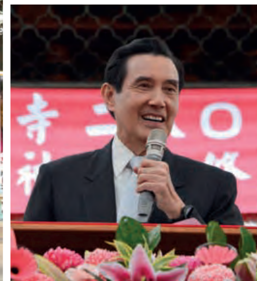
前總統馬英九致詞。