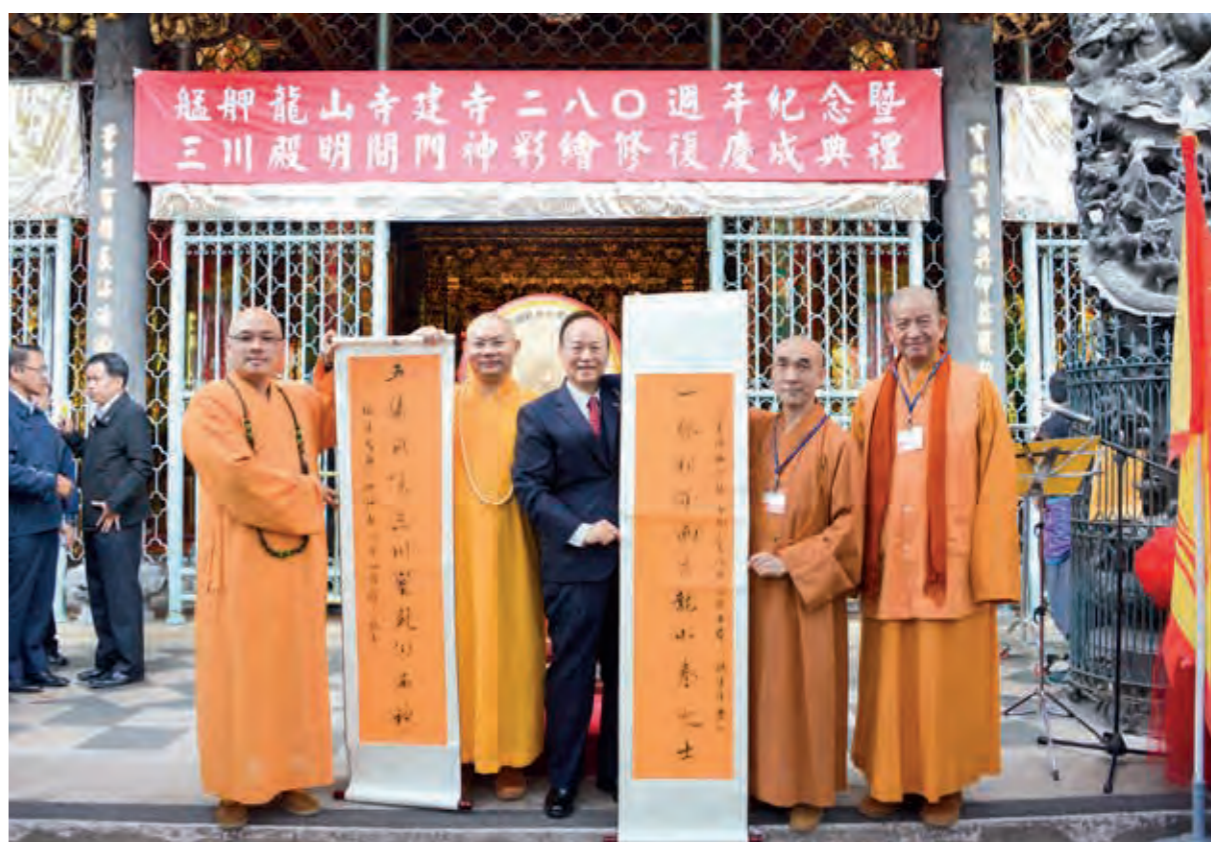
福建晉江安海龍山寺向願住持（右二）率眾前來祝賀。