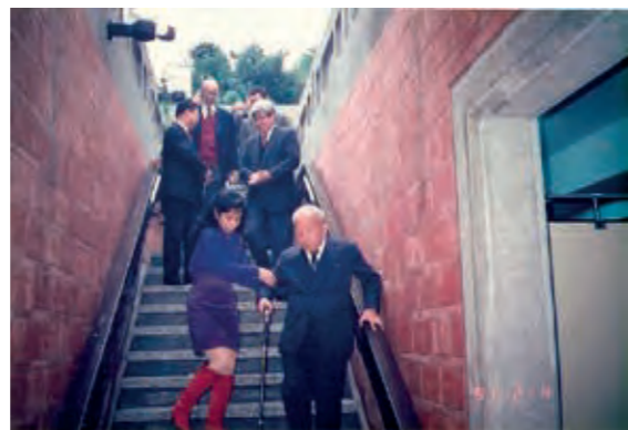
民國 80 年地下廁所完工啟用