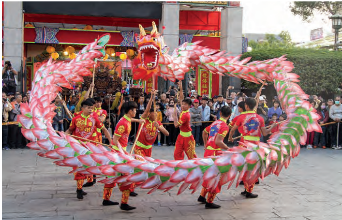
國立體育大學表演的荷花龍，結合了力量速度及藝術美。