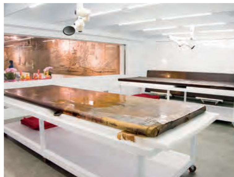
卸下之門神於艋舺龍山文創 B2 的「艋舺龍山寺門神彩繪修復室」進行修復。