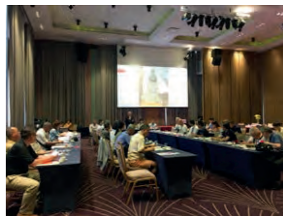
民國 108 年召開第五十六次會員大會

7月27日 召開第五十六次會員大會，個人會員 43 名，團體會員 10 名，合計 53 名。