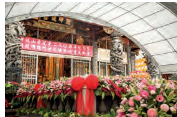
民國 108 年艋舺龍山寺 280 週年慶

11月27日 舉行建寺 280 週年紀念暨三川殿明間門神彩繪修復慶成典禮，由黃董事長書瑋主持，蔡英文總統、馬前總統英九、吳前副總統敦義、前國民黨主席吳伯雄等多位官員到場祝賀。 ~12月3日 舉辦七天護國息災祈安植福大法會。