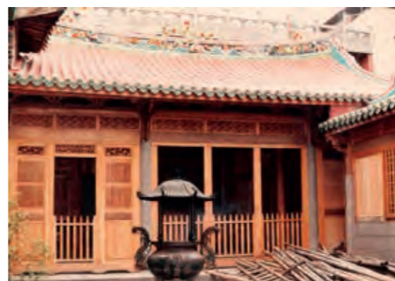
民國 72 年文昌殿火災重修中