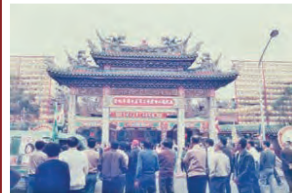
民國 78 年舉行艋舺龍山寺 250 週年慶

11月15日 本寺建寺 250 週年紀念慶典， ~11月21日 前副總統謝東閔、立法院長劉闊才、內政部長許水德、臺北市市長吳伯雄蒞臨。