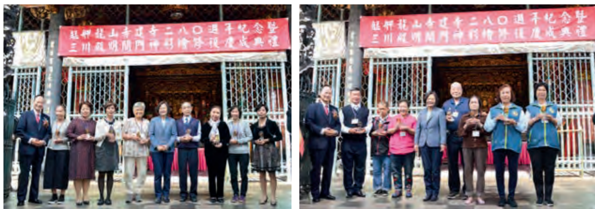
感謝效勞生與誦經生對龍山寺的無私奉獻。

生，每年分上、下學期兩次捐助，每次新臺幣 300 萬元整，讓更多弱勢孩子可以安心就學，順利完成學業，透過教育扭轉經濟劣勢、順利翻轉人生。