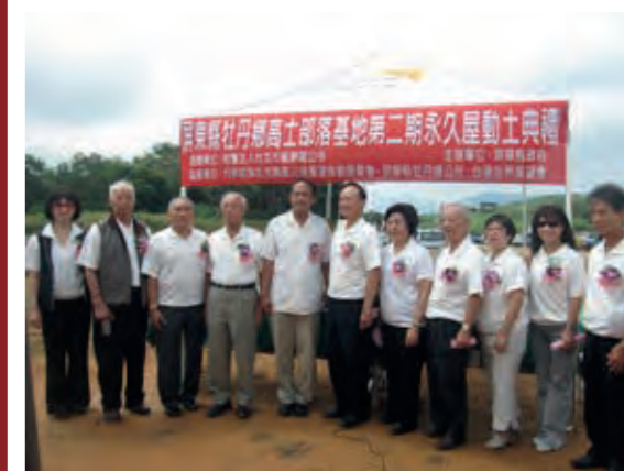
民國 100 年協助屏東縣牡丹鄉高士村莫拉克風災受災戶興建永久屋