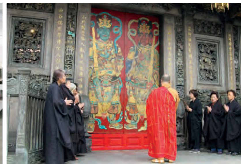
三川殿明間門神哼哈二將回歸舉行灑淨儀式。