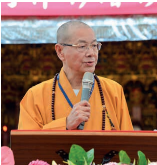
中國佛教會理事長釋淨耀致詞。