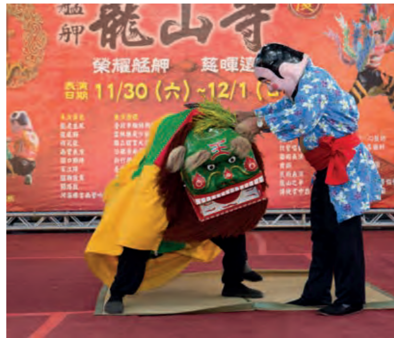
新竹縣客家舞獅文化協會的開口獅，動作細膩，活潑有趣。

新竹縣客家舞獅文化協會的開口獅，動作細膩，活潑有趣。客家人所舞的開口獅，獅面為青色，獅頭略成正方體，額頭上書寫「王」之字號，四方的口型象徵嘴大吃四方，舞獅時必咬草蓆，因為客家人四處遷徙，累了就可鋪下蓆子休息。