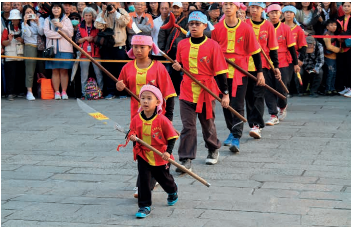
臺南協福堂的宋江陣表演精彩生動。