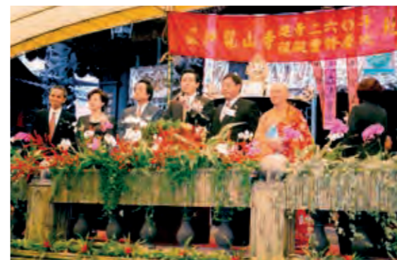
民國 88 年舉行艋舺龍山寺 260 週年慶