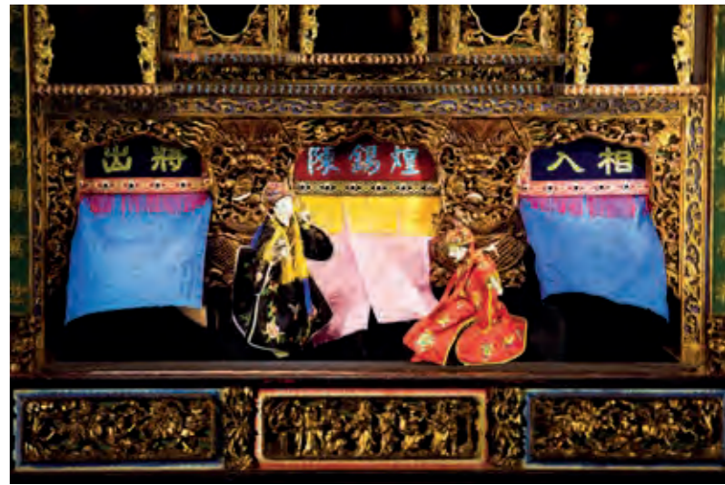
傳統掌中戲勾起了許多人的童年往事。

豐富精彩的表演輪番上陣，舞台前方擠滿了觀賞的群眾，表演者無不使出渾身解數，精湛的技藝令人嘆為觀止，現場掌聲不斷，氣氛相當熱鬧，在歡樂的氣氛中，活動畫下完美句點。感謝每一個表演者，讓節目如此精彩有趣；感謝每一個參與者，讓現場氣氛如此熱絡；感謝有你，活動才能圓滿成功。