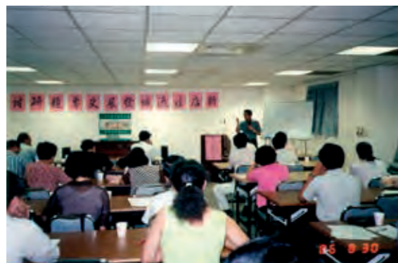
民國 86 年圖書館社教研習班