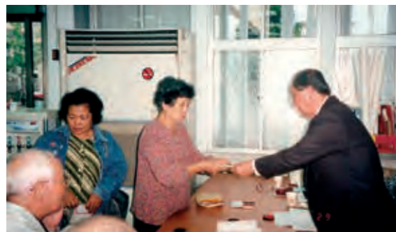
民國 90 年桃芝風災至花蓮致贈慰問金