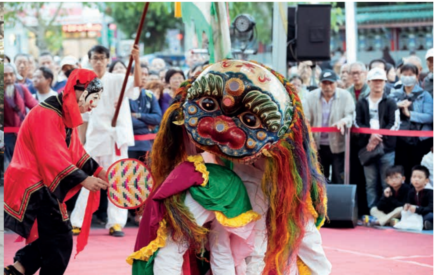
大龍峒無耳金獅團以民間傳說呈現舞獅技藝。