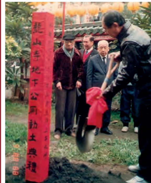
民國 78 年地下公廁動土