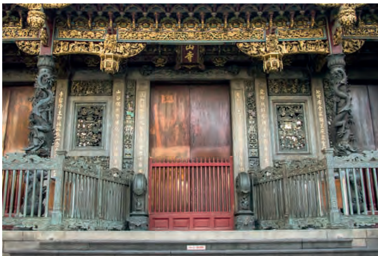
民國 105 年拍攝之照片，幾乎看不到門神的面容。

本工程中之哼哈二將修復工程耗時年餘，完成時適逢本寺二百八十週年寺慶，特於 108 年 11 月 27 日舉行建寺二百八十週年紀念暨三川殿明間門神彩繪修復慶成典禮；三川殿明間門神哼哈二將於 108 年 11 月 14 日舉行灑淨儀式後已正式回歸，風調雨順四大天王門神修復工時預估約為兩年，屆時本寺所有門神將以原創者甫完成時之亮麗面貌，再度回到崗位執行神聖任務，請各位與我們共同耐心等待。