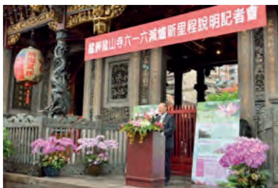
民國 106 年減爐記者會

7月12日 捐贈臺北市政府消防局市民防災手冊 3000 本、住宅用火災警報器 2000 顆；捐贈新北市政府消防局空氣呼吸器 100 套及潛水裝備 20 套。