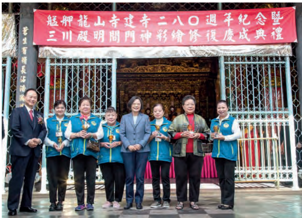
表揚員工的付出與傑出表現。