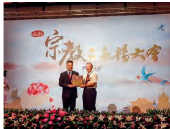
民國 108 年宗教團體表揚大會

8月30日 本寺 107 年度辦理宗教團體捐資興辦公益慈善及社會教化事業達新台幣 1 億 2,098 萬 1,073 元，獲內政部長徐國勇頒發績優宗教團體獎牌。