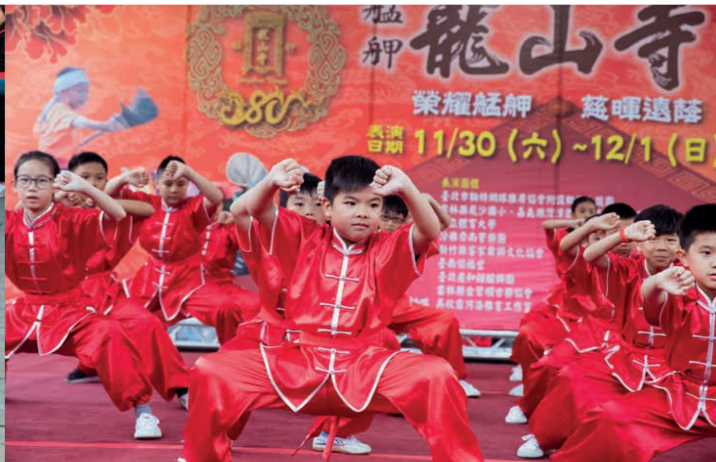
臺北市老松國小的國術隊表演，虎虎生風，氣勢磅礴。