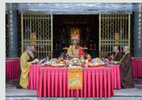
• 圓滿日的餽口施食，將法華功德分享給法界眾生。