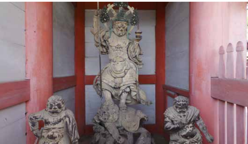
• 日本京都府京都市仁和寺的毘沙門天王像。

鬼二路。人道荒險，鬼道利通。行客心迷，多尋鬼道，漸入其境，便遭殺害。昔有聖王，於其路首，作毘沙門天王石像，手指人路。」由於毘沙門天王是統領諸鬼神的四天王之首，因此用祂的石像來警告絲路上的商賈莫入鬼域，則顯示其「護佑群生、辟除惡鬼」的功德。