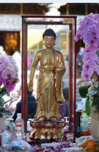
• 修持藥師法門有添福增財的功德，因此也有人稱藥師佛為佛教中的財神爺之一。（攝於艋舺龍山寺）