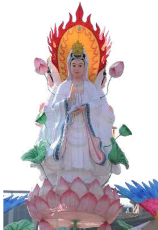
• 2026年元宵花燈副主燈——三面觀音。

著名文本《香山寶卷》曾記載妙善公主（觀音菩薩化身）修道的歷程：從早期的堅定修行，到成道後的普濟眾生，這份「願力」與「行動」始終如一。因此，龍山寺在誕辰月份邀請大眾，不僅是參與慶典，更能效法菩薩「行願」精神，透過誦經、茹素、反省與靜心，作為送給菩薩最珍貴的生日禮物。