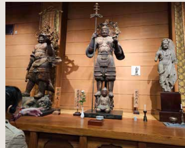
• 日本和歌山縣日高郡道成寺的兜跋毘沙門天王像（中）。

而隨著于闐的佛教盛行與其地理位置，于闐國造型的毘沙門天也彷彿舶來品般席捲了當時的大唐，至於這位天王在漢地又有啥特殊際遇，就待下回分解吧。