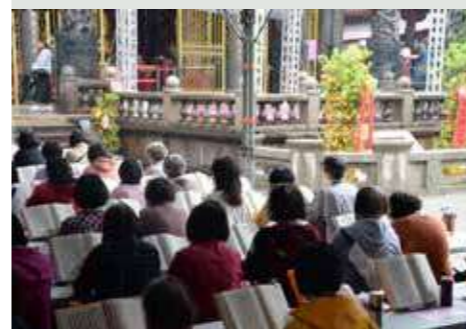
• 眾人持誦《法華經》，契領真理的智慧。