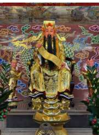
• 天官大帝（堯帝）是道教尊神「三元大帝」之首，職司「天官賜福」，掌管賜予人間福份與財祿，民間常於上元節祈求其賜福、增添財庫，在民間信仰中被視為廣義的「財神」。（攝於北投關渡宮）