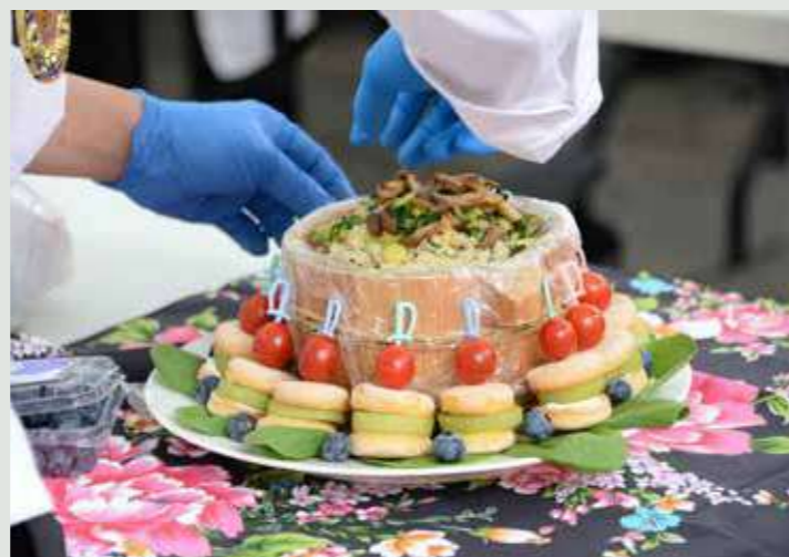
• 各色蔬果在烹飪者的巧思化作精緻素饌。

信眾。這不僅是一場感官的盛宴，更是一場教育，讓大家體會到茹素也能很美味，進而將「護生」的理念落實於飲食，延續善的循環。