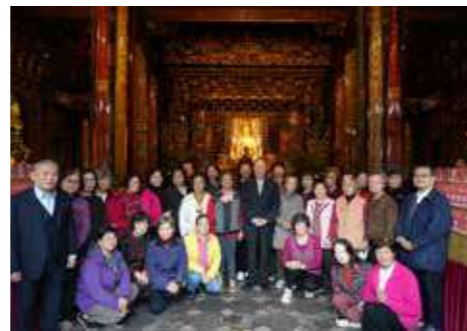
• 董監事與本寺師兄師姐合影（2）。