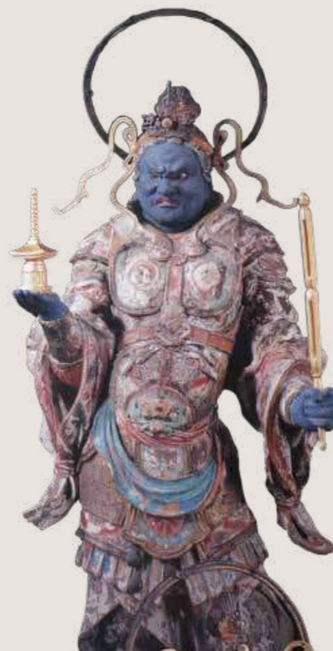
• 日本京都府木津川市海住山寺的毘沙門天王像。

另一方面，在西北印度，當地信仰的夜叉財神最初並非俱毗羅，而是「半支迦」，例如《佛母大孔雀明王經》提到各地夜叉神的住處