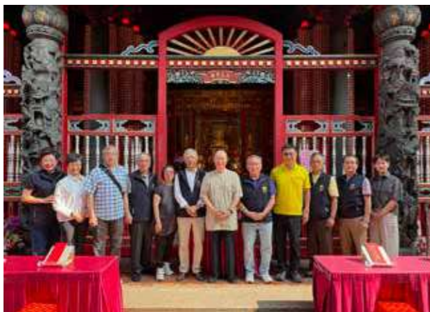
• 艋舺龍山寺董監事與賓客於重光安座日，在媽祖聖像前合影留念。

神靈的存在，雖不拘於有形外相，然為方便世人瞻仰有所歸依，木石雕漆金身便成了連結天人的橋樑。但凡有形物質皆難脫「成住壞空」之循環，後殿的媽祖暨女官聖像亦隨歲月斑駁。為此，龍山寺遂於2024年啟動修復，蒙善信發心捐輸護持，經專業團隊歷時兩載精心修繕，終使聖像重現莊嚴神韻，讓信眾與神明間橫跨時空的情感，再次得到了溫柔的延續。