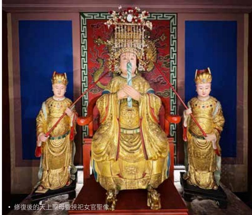
• 修復後的天上聖母暨挾祀女官聖像。

艋舺龍山寺後殿天上聖母暨挾祀女官聖像，歷經兩載悉心修復，於國曆2026年4月19日重光安座。隨後於5月2、3日啟建「供佛大齋天」法會，以此至誠盛典慶賀，延續百年信仰情緣，守護萬家康泰。