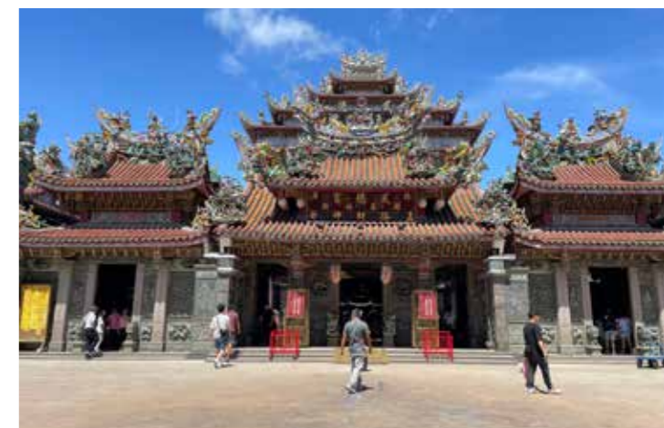
• 北港武德宮主祀以中路財神趙公明為首的天官五路武財神，是南部地區熱門的求財聖地之一。