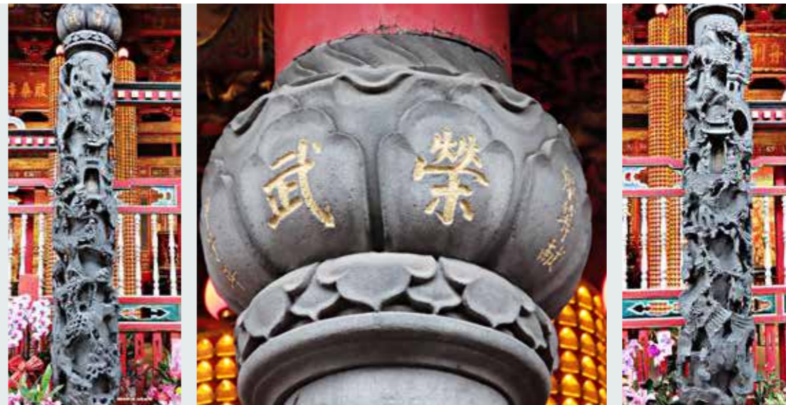
• 天上聖母殿中門虎邊人物柱 〈浮生記趣／水畔採蓮〉。