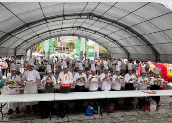
• 數十位大廚們手持佳餚敬獻於菩薩座前。