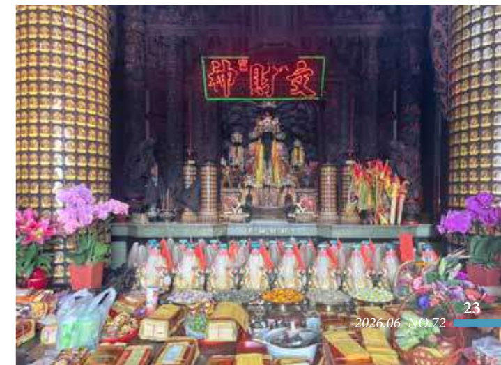
• 嘉義文財殿是臺灣罕見主祀文財神比干的財神廟。

兼職財神最著名的就是福德正神（土地公），土地公成為另類財神，源於「有土斯有財」觀念，早期農業社會，五穀豐收即是最大的財富。隨著時代演進，現代人則多向土地公祈福、求財、保平安，臺灣許多著名的財神廟主祀神明就是福德正