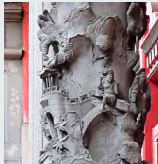
• 惠安匠師工藝精湛設計高明，雕刻市井小民暫歇腳坐於橋頭的浮生樣態。

天上聖母殿中門龍邊人物柱〈浮生記趣／林下賞梅〉，上段雕刻蒼鬱樹林、涼亭路徑中，可見鹿隻行走於岩壁上；偶見短褂路人揹著包袱在山間攀爬，登高望遠。中上段雕刻雙簷樓閣亭臺，閣內雕「武榮敬獻」，字體按金；閣外站立羅漢拿著不求人搔背止癢，滿臉舒暢；百姓