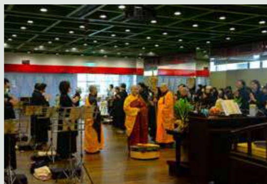
• 一日一夜持八關齋戒，培養福報與福德。

將祝壽提升為個人的心靈成長與慈悲實踐，就是對菩薩最真實的供養。當我們能像觀世音菩薩一樣，在日常生活中體貼他人的需要、平復自己的情緒，我們就是在「行願」。以行動為禮物，以實踐來祝壽，我們共同在繁忙的人間，開拓出一條安穩、祥和的生命之道。