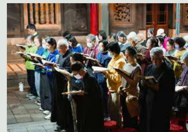
• 在一禮一拜間，揮除塵囂，反思過往的行為。