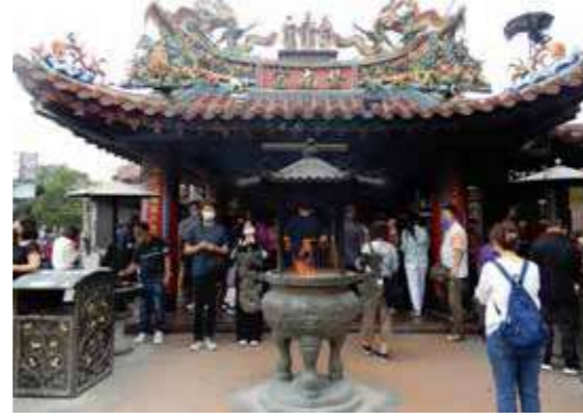
• 南投竹山紫南宮主祀福德正神，是臺灣人氣超強的財神廟。

每逢農曆新年期間，財神信仰更是達到高峰。大年初五被稱為「迎財神日」，許多民眾會前往廟宇參拜，祈求新的一年