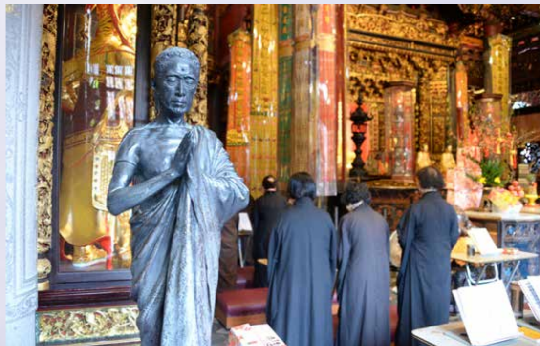
• 透過《法華經》，受持、讀、誦、解說、書寫等五事修行，進而「六根清淨」。

上述的淨化方法，可於日常生活中運用；若是出世道的精進，亦可從早晚課、誦經、聽經開始，透過固定時間的長期薰習，慢慢洗刷潛意識中的煩惱污垢，將原本向外攀緣的習氣，轉向內在的平靜。透過《法華經》的受持、讀、誦、解說、書寫，喚醒自己的佛性，解脫六根的束縛，超越人道的侷限，進而達到自性清淨，證悟佛道。