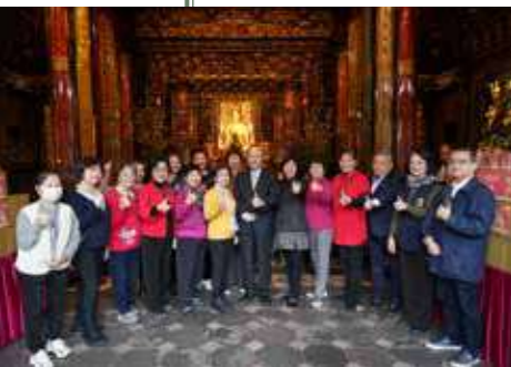
• 董監事與本寺師兄師姐合影（1）。

每位師兄師姐來到龍山寺當志工，背後或許都藏著一個與佛祖的小秘密，或是一份深沉的感念。與眾不同的是，他們願意將信仰化為具體的行動，用歲月守護這座寺宇，用汗水莊嚴這片淨域。這份不疲不厭的心意，著實不易。在此，向所有在任、退休的效勞生、誦經生，以及背後默默支持的眷屬們，致上最深切的敬意：「因為有您們，艋舺龍山寺才更顯溫情與輝煌。」