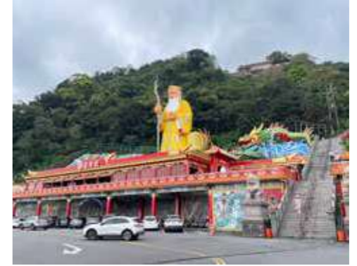
• 烘爐地南山福德宮是北臺灣求財最旺的土地公廟。

財運亨通、生意興隆。有些人還會在家中供奉財神像，擺設供品如水果、糕點與金紙，以表達敬意與祈福之心。除了宗教儀式，財神文化也融入日常生活，例如商家開幕時會舉行「拜財神」儀式，象徵開市大吉；公司行號或商家也常在重要節日祭拜，希望業績蒸蒸日上，並將財神相關的吉祥物擺飾放在櫃檯，以求心理安慰與招財運。各地財神廟則提供各式各樣的祈財方法來滿足人們的求財需求，如點財神燈、補財庫、換錢母、求發財金、求財寶箱等等，將宗教信仰與現實生活結合，形成具有地方特色的財神文化。