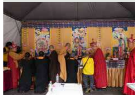
• 二十四席功德主在法師的引領中敬獻妙供予諸天善神。

此次媽祖聖像修復暨重光安座等諸慶典得以功德圓滿，感謝十方信眾的發心護持，令此盛事倍增殊勝。祈願聖母慈光普照，令社會安和、災障消弭；庇佑萬家生輝、老幼平安。願凡參與此聖事者，皆能同霑法喜、福慧雙增，法界普皆吉祥。