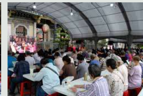
• 許多信眾前來共襄盛舉，在廟埕誦經區一同誦經。