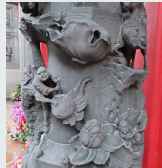
• 石匠雕刻蓮渥池內碩大的蜷曲蓮葉，百姓手持工具採摘蓮蓬的生活百態。