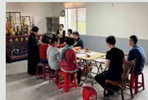
• 一切的莊嚴與美好，背後都是有一群為善不欲人知的「觀音小幫手」在努力。

「咚——咚——」鐘鼓聲揚，早課正式開始。正殿內，誦經生換上整齊的海清、搭起縵衣，方才灑掃時的俐落化作了此時的肅穆。他們司執法器，魚磬聲與梵唄聲交織，帶領大眾禮佛誦經。無論是每日朝暮課誦、共修活動，還是年度法會慶典，誦經生的身影從不缺席。他們不僅是經文的傳誦者，更是法會現場的安定力量。在人群喧鬧中，他們一個指引、一個手勢，都讓信眾感到無比安心。