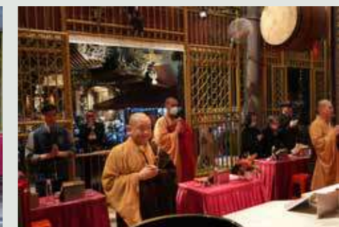
• 夜晚的龍山寺燈火通明，法師帶領大眾禮懺。