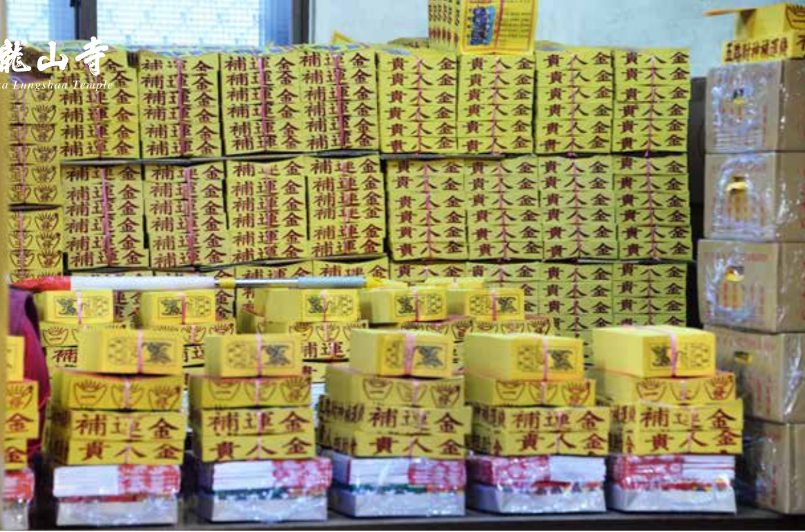
• 民眾求財納福的心理與追求，充分反映在一系列民俗活動中，各式各樣的求財儀式與民俗活動也豐富了財神信仰的內涵。 (攝於臺中廣天宮)

農 曆過年大年初一，人們見面的第一句話就是互道「恭喜發財」，反映了人們對財富的追求與對未來一年富足生活的期盼。錢財為日常生活中不可缺之物，俗話說：「錢不是萬能，但沒有錢萬萬不能」，可看出錢財在日常生活中的不可或缺。適度的財富是人們在日常生活和事業上不得不追求的目標，所以祈求財富本身並不是一種醜陋的功利行為，而是能成就更好的生活環境的助力之一。