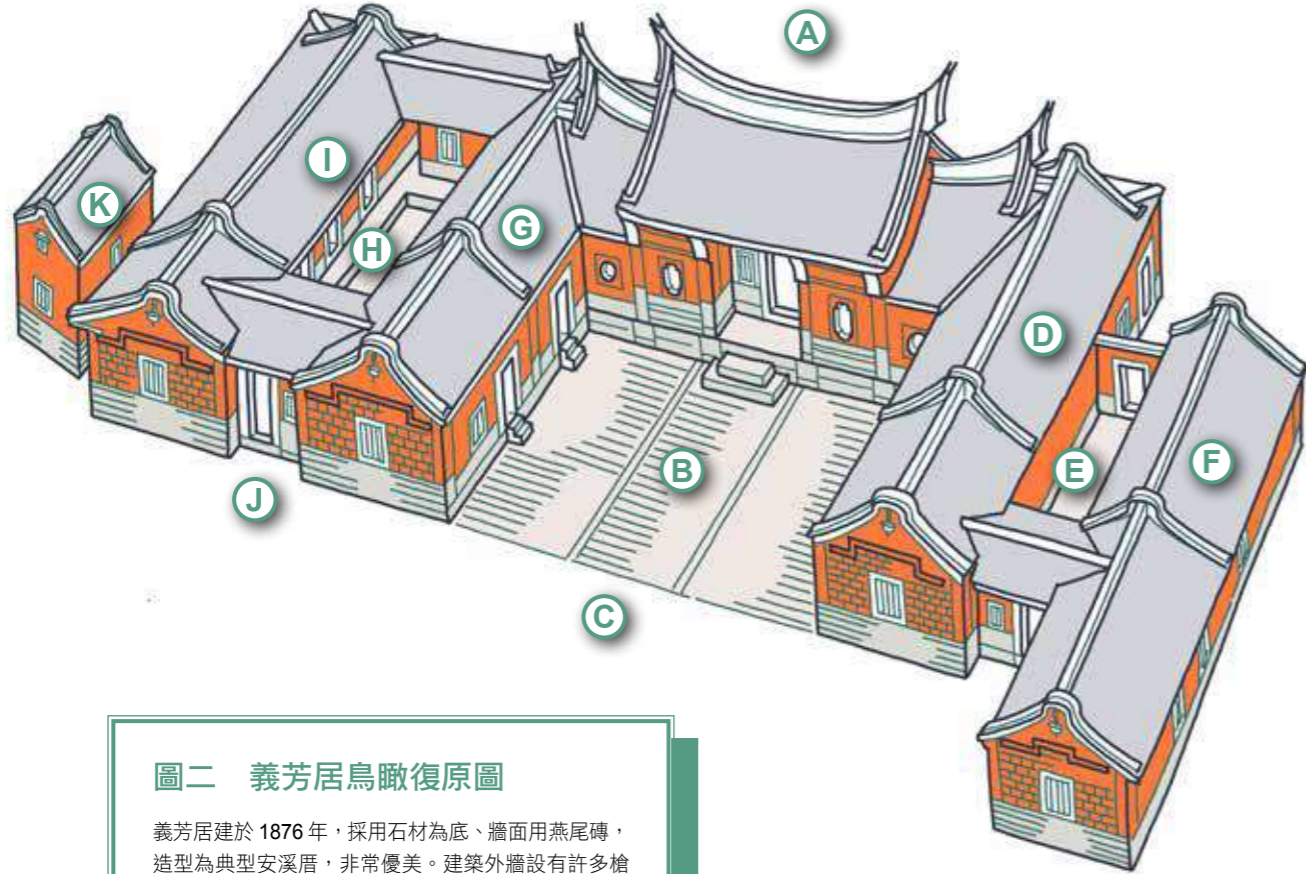
圖二 義芳居鳥瞰復原圖

義芳居建於 1876 年，採用石材為底、牆面用燕尾磚，造型為典型安溪厝，非常優美。建築外牆設有許多槍眼，虎邊外側甚至還建造槍樓，可防盜匪入侵。