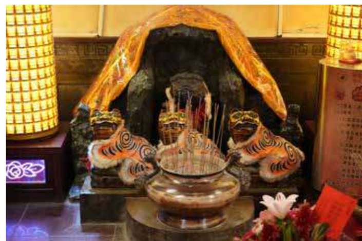
• 相傳虎爺因為跟隨財神爺趙公明，因而獲得「咬來錢財」的能力，也因為虎爺的臺語發音相近「好野（有錢）」，民間普遍認為祭拜虎爺有助於旺財運。（攝於松山慈祐宮）