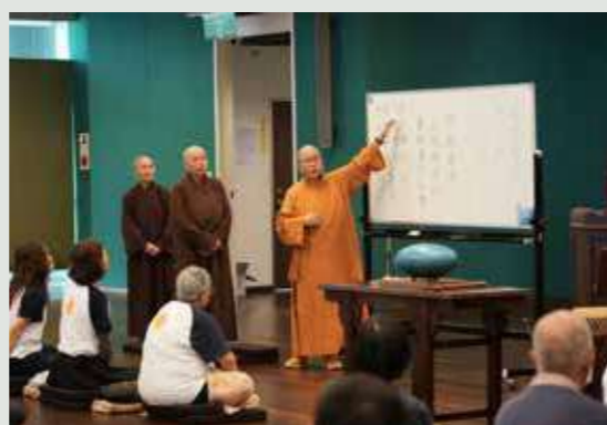
• 禪修者在法師的教授中，從呼吸間找回自覺。