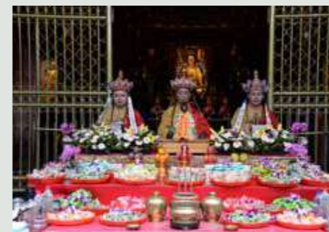
• 三師和尚登上法臺，依餗口儀化食濟度幽冥眾生。